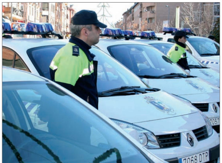
Dos agentes en la presentación oficial de los vehículos en la Calle Real

En la actualidad, Las Rozas cuenta con uno de los mejores y más modernos parques móviles dedicados a la seguridad ciudadana de la Comunidad de Madrid, compuesto por 19 coches patrulla, 3 vehículos camuflados, 1 todo terreno, 1 furgoneta de atestados y 10 motocicletas, 2 de ellas de campo. La antigüedad del parque es inferior a los 4 años.