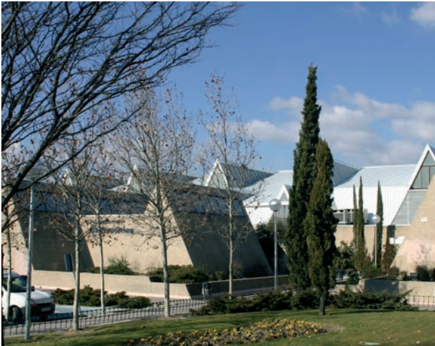
En la imagen, el Centro Polideportivo de Entremontes

Esta primavera comenzarán los trabajos de construcción de este nuevo Pabellón. Este anexo al Centro Polideportivo de Entremontes está diseñado específicamente para la práctica de esta disciplina deportiva por lo que cuenta con una pista de 715 m 2 y un foso de 91 m 2 . La grada está pensada para albergar a unas 150 personas aproximadamente.