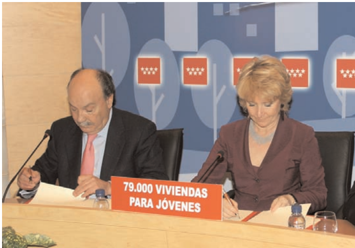
El Alcalde de Las Rozas, Bonifacio de Santiago, y la Presidenta de la Comunidad, Esperanza Aguirre en un momento de la firma del convenio

El pasado 18 de enero tuvo lugar en el Salón de Plenos la firma del convenio con la Comunidad de Madrid, por el cual el Ayuntamiento de Las Rozas se incorpora al Plan Joven con la construcción de las primeras 600 viviendas en nuestro municipio. Éstas, en régimen de alquiler, podrán adquirirse pasados 7 años, por un precio final aproximado de 139.000 €, lo que supone un ahorro del 54% del precio de mercado estimado. Estas viviendas tendrán una renta mensual en torno a 515 €.