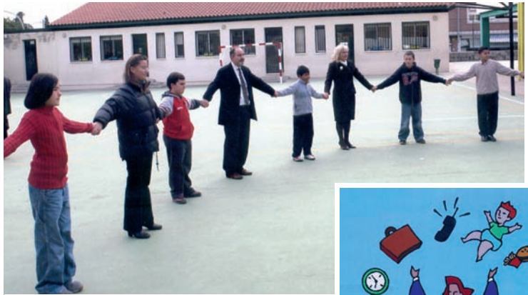
En la imagen, la Concejala de Igualdad de Oportunidades, Servicios Sociales y Familia junto al Director y alumnos del Colegio Público Vicente Aleixandre

Una casita sobre ruedas sirve de modelo para entender en qué consiste la conciliación y de qué manera se puede conseguir. El Bus invita a reflexionar y comprender las ventajas del ejercicio de las buenas prácticas que favorezcan la conciliación. Juegos y actividades lúdicas ayudan a interiorizar los mensajes y las claves del programa "por igual"(X =).